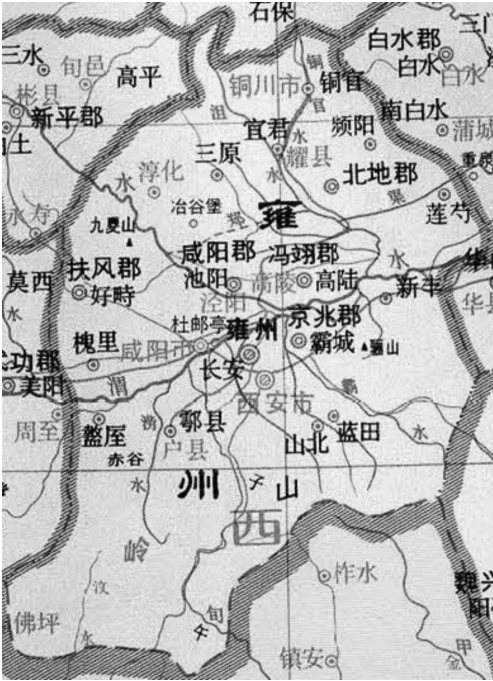
图1 北魏时期的雍州(497)